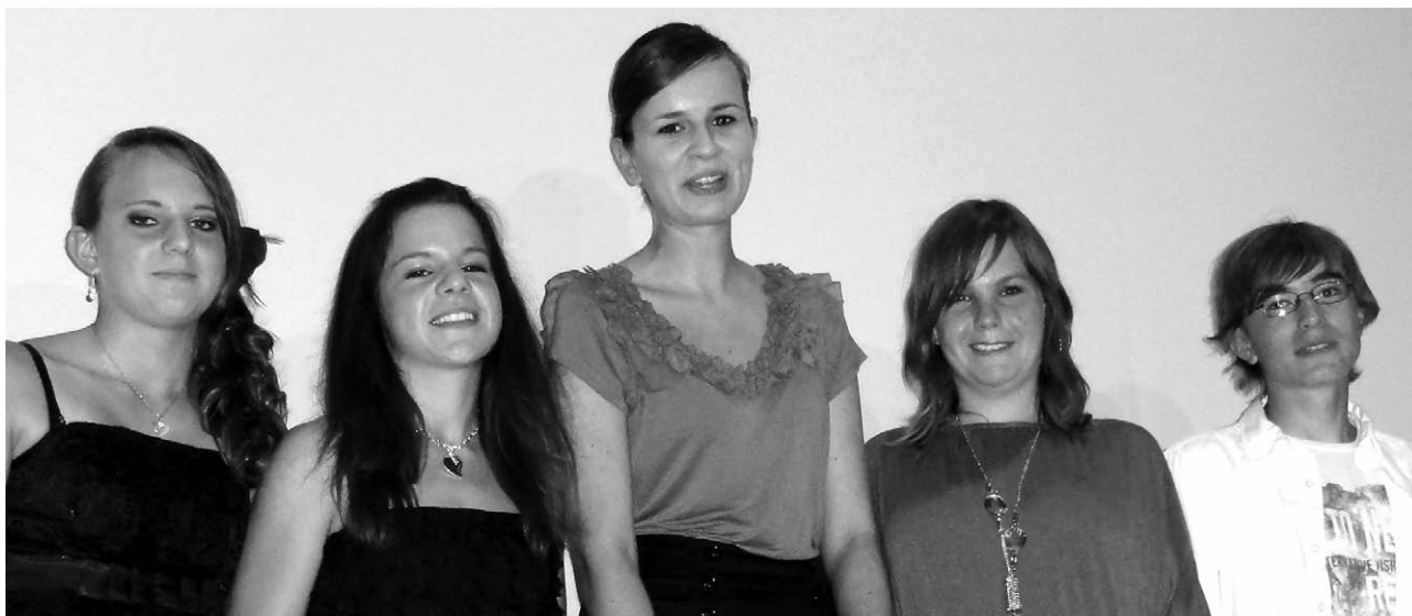
Diese fünf Jugendlichen wurden vom Schulrat für ihre hervorragenden Abschlussarbeiten ausgezeichnet.