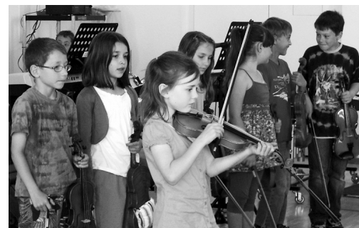
Die Projektstage brachten allen reiche musikalische Erfahrungen.